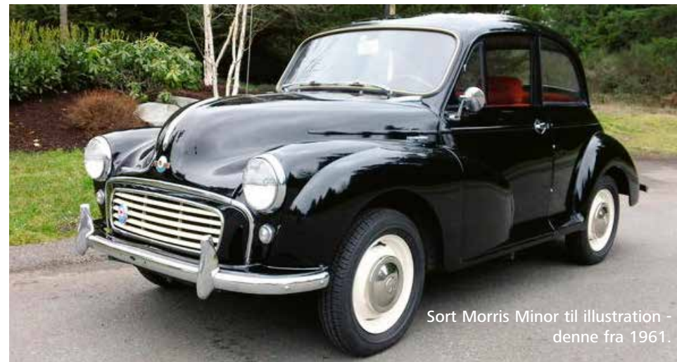
Sort Morris Minor til illustration - denne fra 1961.

Sidst jeg talte med saddelmageren, sagde han at det var en skrøne. Vognen var solgt til en mand i Grejsdalen, og han var glad for den, og den var ikke til salg. Der kunne i stærk solskin være en svag lugt, men Wunderbaum er jo opfundet.