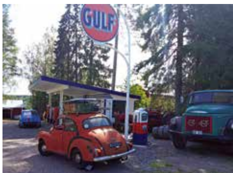
Lokal tankstation i Rovaniemi området i Finland.

Deroppe kan man virkelige mærke at naturen har ændret sig. Der er skov alle vegne og det vrimler med klipper og natur. Hele turen i gennem gik vi begge med ambitioner om at se en vild elg.