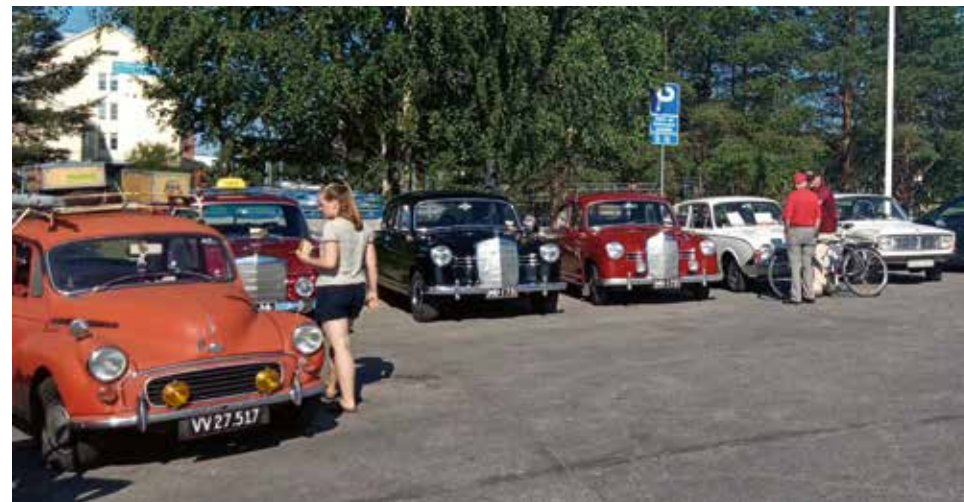
Uventet invitation til lokal rally deltagelse i Lapland.

Vi stak nordpå op i Finland mod Rovaniemi, som man siger er Laplands hovedstad. Rovaniemi området var meget interessant og vi blev her nogen dage for at slappe lidt af. Vi startede med at indlogere os på en campingplads lidt udenfor byen. Her mødte vi en fotograf fra et finsk veteranbilsblad. Vi blev inviteret til et "rally" som foregik morgenen efter kl. 8. Uden at kende nogen troppede vi friske op kl. 8 på en lokal tankstation i byen og vi mødte masser af andre biler og bilentusiaster. Vi var de eneste som ikke kom fra klubben og ikke kunne tale finsk, så udfordringer var der masser af. Løbet var en form for skattejagt hvor vi