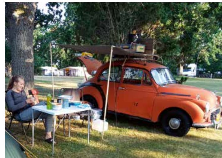
7-8 timers Morris-kørsel pr dag kræver en stille stund om aftenen.

Hvis nogen vil vide mere eller kontakte os er I velkomne på mobil 42801706 eller mail lau_glem@hotmail.com