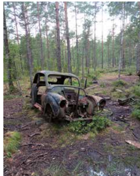
Den vidtstrakte bilkirkegård ved Tingryd i Sverige.

Virkelig en speciel oplevelse hvor hundredvis af klassiske veteranbiler ligger og forgår i skovbunden, på en måde et smukt syn. Fra Tingsryd kørte vi direkte hjem og parkerede bilen derhjemme.