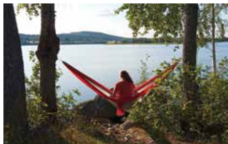
Flot skærgård skal nydes!