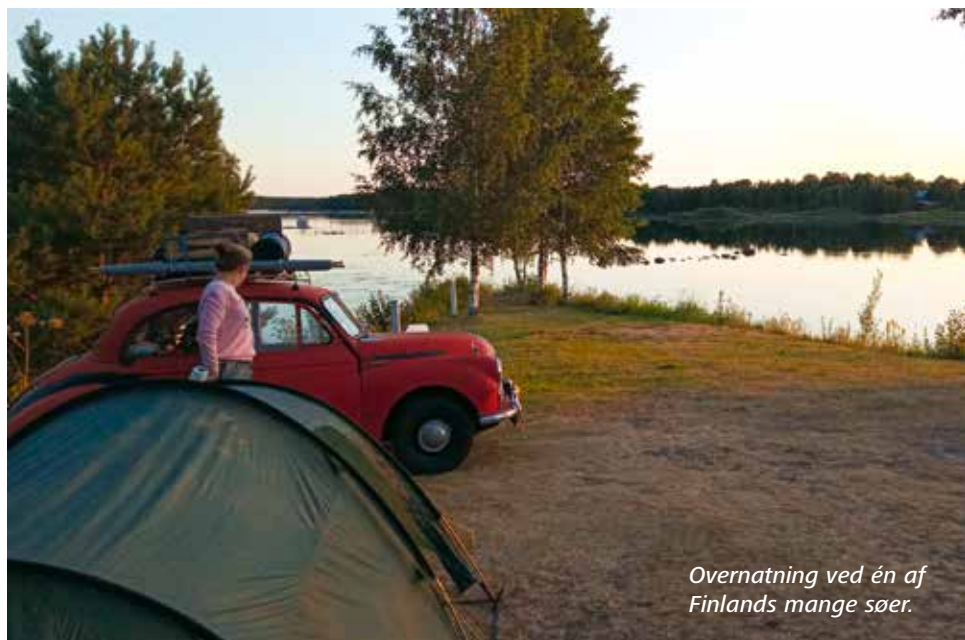
Overnatning ved én af Finlands mange søer.

I Stockholm gik vi rundt i 2 dage og nød at være tilbage i Sverige. Stockholm er en fantastisk by og vi kunne sagtens have haft brugt en hel uge, men skolestart kaldte derhjemme og jeg glædede mig også til at starte et nyt kapitel i mit liv. På vejen ned mod det Skånske stoppede vi forbi en bilkirkegård nær Tingsryd.