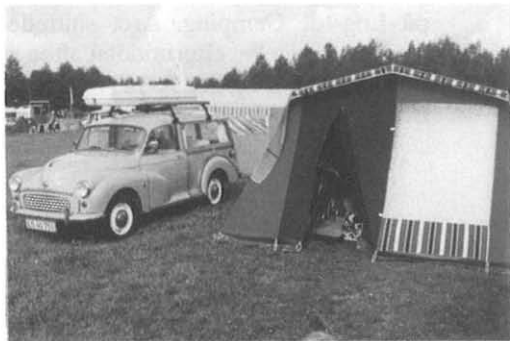
Pak bilen, familien og teltet og kom til Sommertræf i Ålesund den 12. - 14. juli

Her finner du Prinsen Strandcamping: (Vi skal sørge for god skilting!)