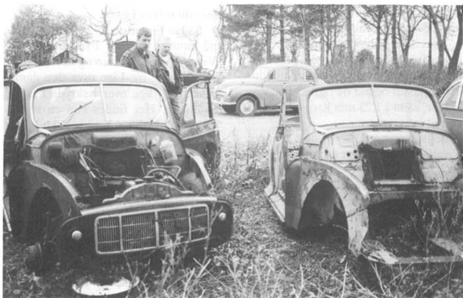
Split-screen cabriolet og 2-dørs billigt til salg