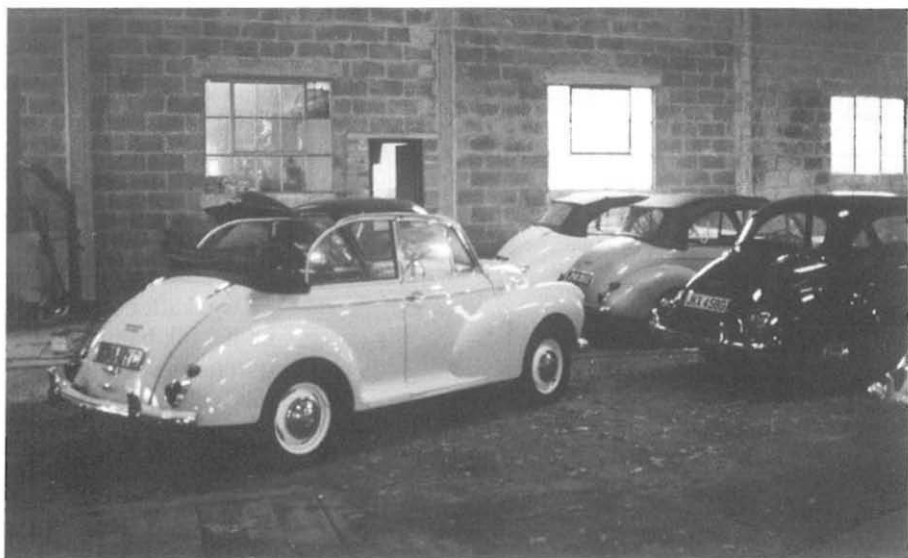
Morris Minor cabriolet