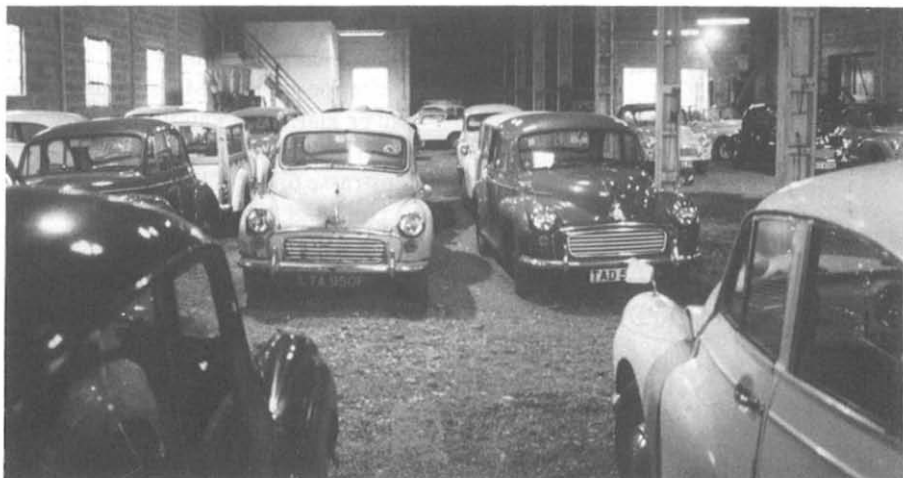
Nogle af de mange urestaurerede Morrisser