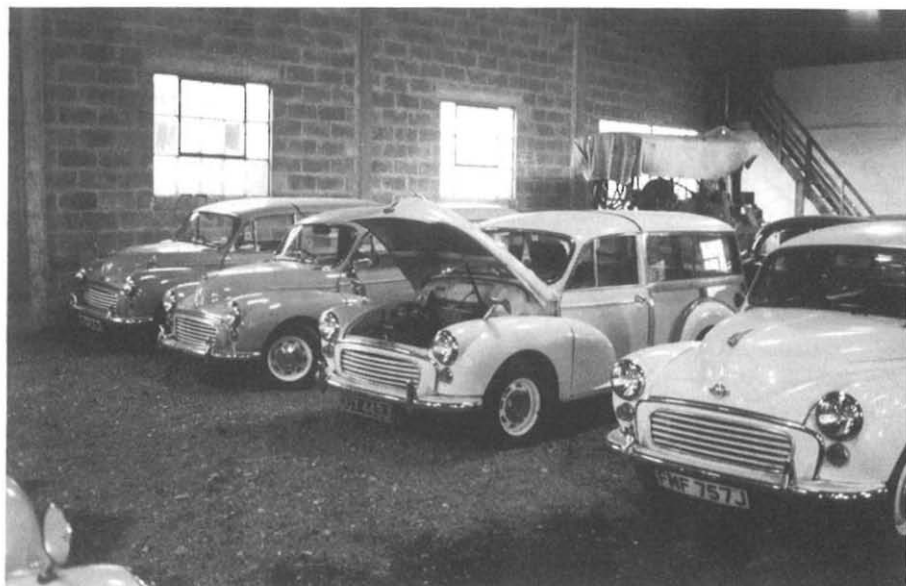
Et par restaurerede Serie III Traveller