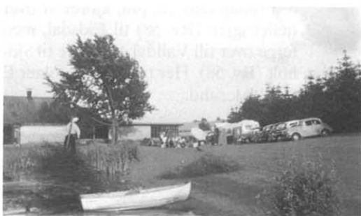
Fra Sct. Hans-træffet 1990

Jeg er ved at prøve at samle alle sange om Minoren, da jeg syntes det kunne være spændende at se hvor mange der er skrevet til forskellige træf og andre lejligheder. Hvis jeg får samlet nok, vil jeg samle dem til en bog og da det kunne være at der var andre der kunne tænke sig en sådan bog, vil jeg sende klubben et eksemplar, så klubben kan mangfoldiggøre den.