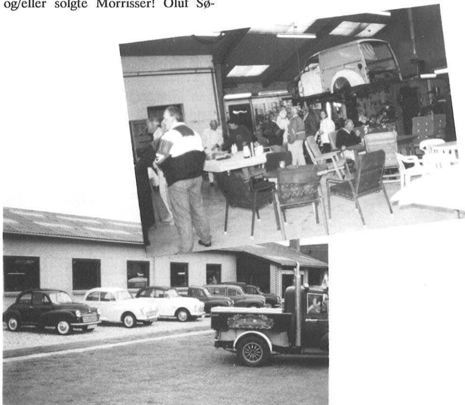
Et par glimt fra receptionen hos Søgaard den 27. august 1992.