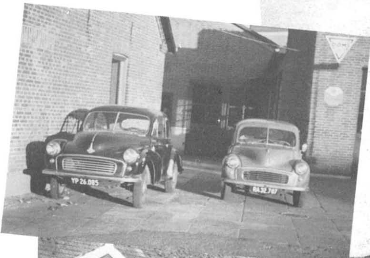
Fra Domi i Glostrup 1956