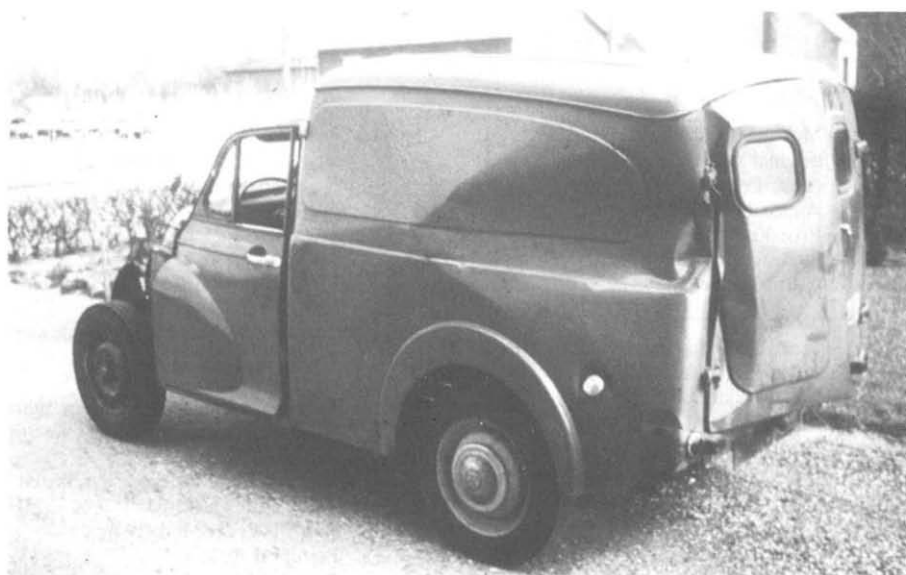
Martin's 3. Morris som den så ud da han købte den . . . .

. . . . og som den kom til at se ud senere!