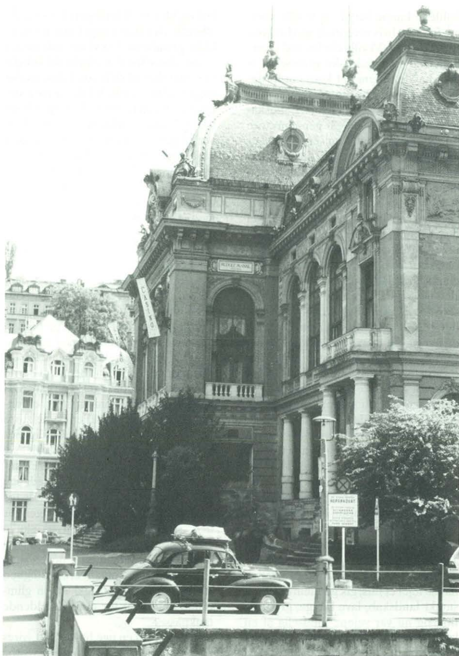
Morris 1000 med oppakning foran Kasinoet i Karoly Vary