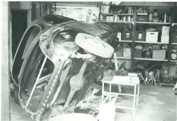
Om på siden med Kareten når der skal skiftes blik i bunden. Det giver en god arbejdsstilling!

I oktober 1990 blev bilen synet og indregistreret og blev så ellers puttet af vejen i garagens beskyttende ly, bortset