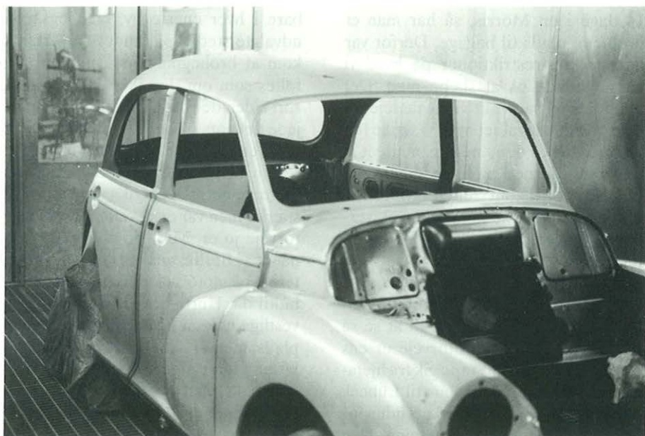
Så er maleren i gang