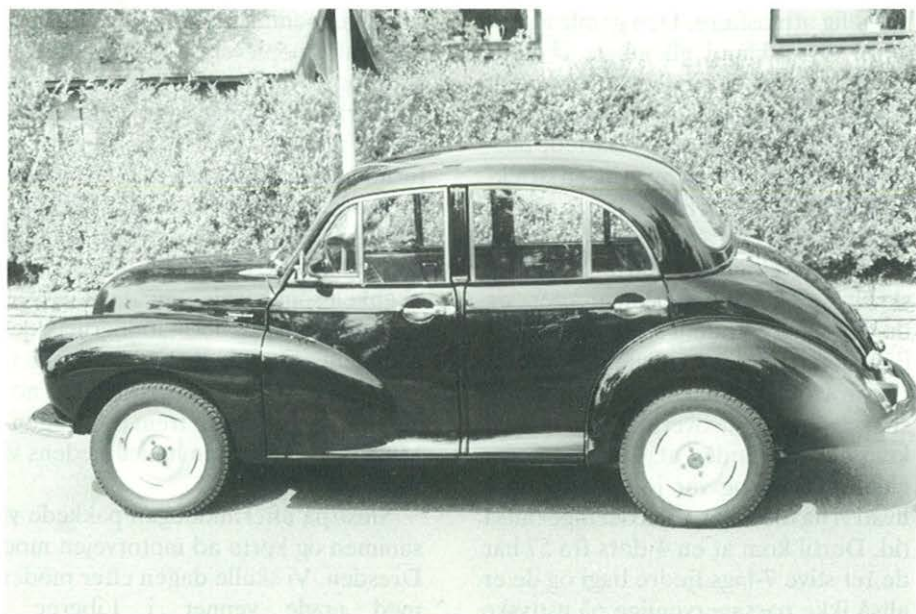
Det næsten færdige resultat