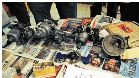
Fra værkstedsaftenen 2017, hvor emnet var karburatorer.