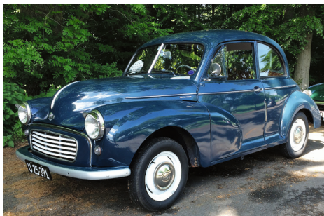
Morris Minor, årgang 1954, Splitscreen

Min tanke på bil nr to var selvfølgelig en Morris. Moster spøjte jo stadig ind i mellem, så efter lidt søgen fandt jeg endelig en fantastisk split