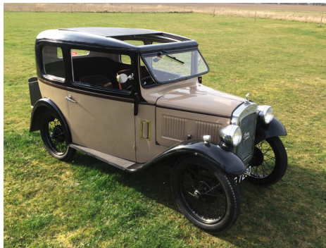
Austin Seven, årgang 1932 med sporvidde på 103 cm

Kalechen var, på trods af, at der var monteret en helt ny, lidt utæt ved dørene, og når den var slået ned, trak det ad pommern til i nakken, hvis man kørte bare lidt friskt til, og apropos frisk kørsel, så er det jo så som så hvad en 1300 ccm, godt nok med dobbelt SU, kunne præstere. Så det korte af det lange; vi besluttede at sælge Triumphen, for nu skulle vi have rigtig veteranbil igen. Moster spøjte endnu engang i tankerne, for nu var hun sat til salg igen, men prisen var lidt for høj til budgettet, og som min kone sagde, så havde vi jo haft hende før, så hun blev endnu engang slået ud af tankerne.