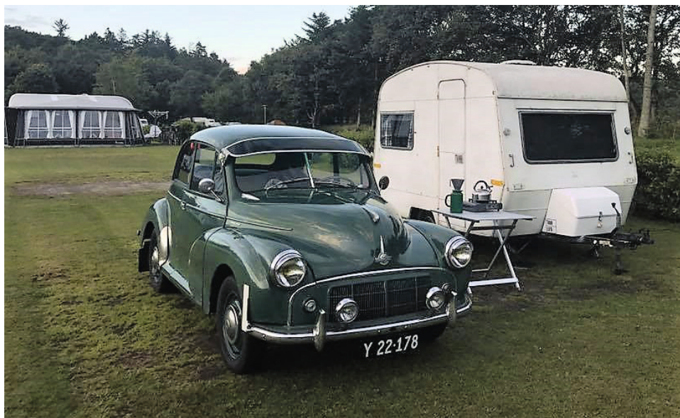
Morris Minor, årgang 1953 med Sprite 400 fra 1967

Morris er ikke det eneste, der står i garagen, så vi har valgt at være klubmedlem i DVK – men skønt at se alt Morris stoffet i NMMK's facebook gruppe.