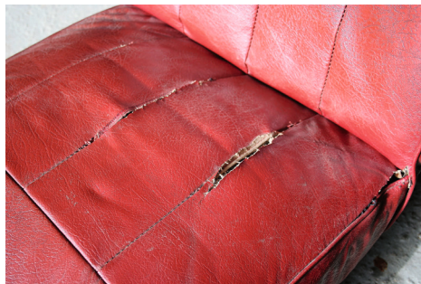
Førersædet i meget ringe forfatning.