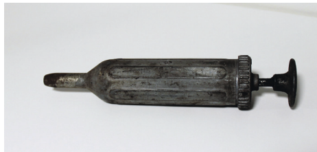
Den lille oliepresse til påfyldning af olie i tandstangen.

Hvis man læser i Instruktionsbogen til Morrissen står der under Anbefalede Smøremidler at man på bagaksel og i Tandstangsstyringen skal bruge en Hypoid 90 olie. Til at påfylde olien på tandstangen findes der en lille fedt/olie presse, der har været en del af bilens vedligeholdelses udstyr.