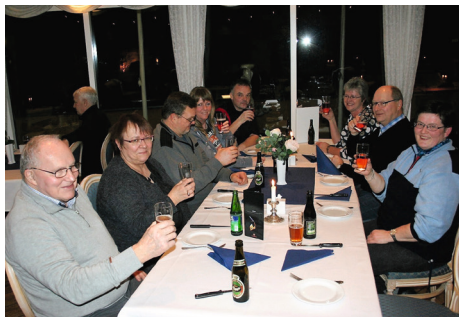
Et billede fra Nytårskuren 2015 på Hyrup Kro.