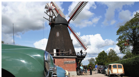
Fra et tidligere Morrisbesøg på Uldum Mølle - Pinsetræf 2016.

Tirsdag den 13. februar 2018 har vi et fællesarrangement med DVK Uldum.