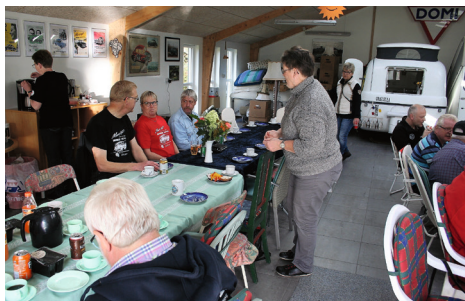
Der var dækket op i garagen i Engsvang.