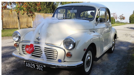
«Moster» i festtøjet efter stor renovering.

Jeg begyndte at lede i diverse annoncer - valget stod mellem VW og Morris, da jeg efterhånden havde fundet ud af, at de begge var rimelig nemme at gå til, og delene ikke var de sværeste at få fat på!