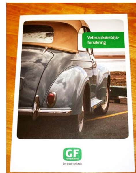
GF Veterans brochure med registreringsblanket og betingelserne er prydet af en Morris Minor Cabriolet.

Prøv at tage GF Veteran med i jeres næste forsikringsovervejelser – de støtter os og vi støtter dem.