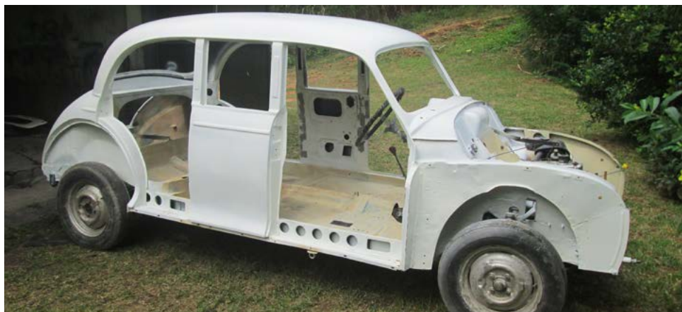
De ekstra sideruder er standard fra en 4-dørs. Billedet her er fra 27. november 2014.

er bilen helt standard. Vægtforøgelsen er på ca. 70 kg og med den længere akselafstand er den helt anderledes komfortabel, især på ujævn vej. Jeg glæder mig meget til at få den grundigt afprøvet og finde ud af om der er noget vi kan forbedre.