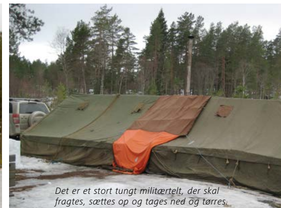
Det er et stort tungt militærtelt, der skal fragtes, sættes op og tages ned og tørres.