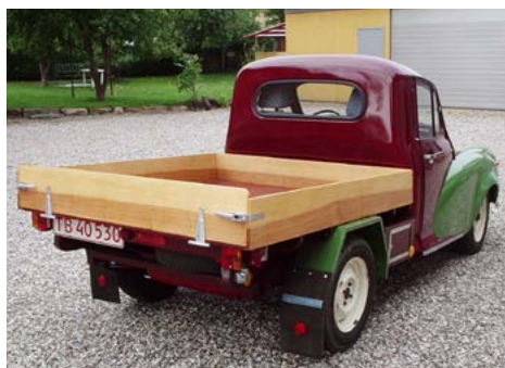
Den nye Camper – endnu som PickUp – blev synet!

Bilen er med brede skærme foran så det passer til hjulene, der var lidt ændring med hensyn til boltene. Der måtte fræses lidt skråt og dybere men det er i orden nu. En god ven stiller lygter og udstødning så der er bestilt tid til den 15. marts så håber vi på plader. Men hovsa, hvad så med alle de løse dele 2 cykler, fortelt, læskærm, reservehjul, vanddunk, værktøj .... humm det må vi finde en løsning på til næste blad. Hilsen Willy