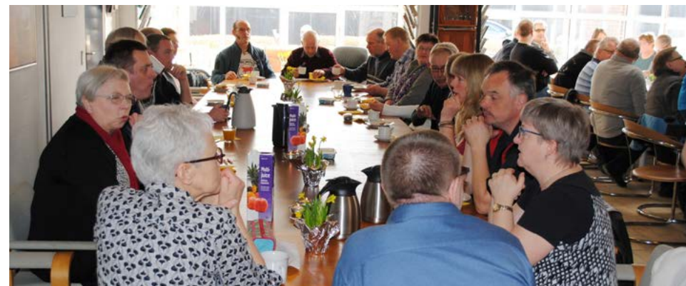
Velbesøgt generalforsamling – her bord 1.