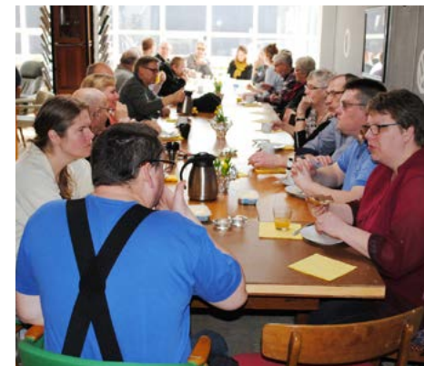
Lyst og godt lokale hos Autogalleriet i Herning – her bord 2.