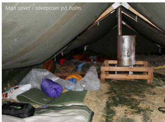
Man sover i soveposer på halm.