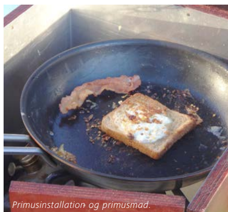
Primusinstallation og primusmad.