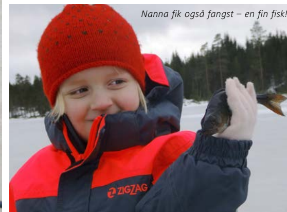
Nanna fik også fangst – en fin fisk!