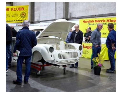
Velbesøgt stand på Fredericiamessen 21. -22. marts 2015.

Maj måned byder på 4 træf – fordelt med én uges mellemrum. Så er træf-sæsonen for alvor i gang.