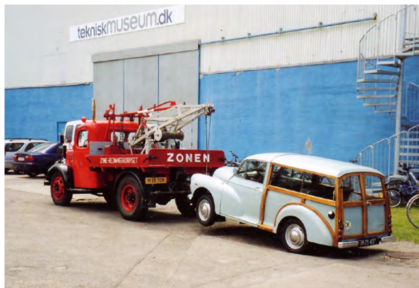
Juni 2006, Den fejler skam ikke noget. Blot en opstilling ved åbent hus på Teknisk Museum.