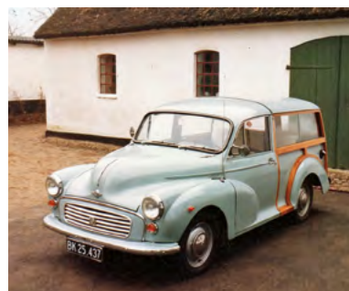
Nov 1984, Gl. Frederiksborgvej 31. Nu er vi flyttet på landet.