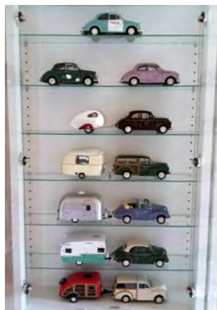
Model morriser klar til træf

Alt er klar til træf blandt modellmorrissene i Grejsdalen. Der vil være politi eskorte og mange imponerende camping-træk! Der er tale om store modeller – biler i 1/18 og campingvognene er 1/24.