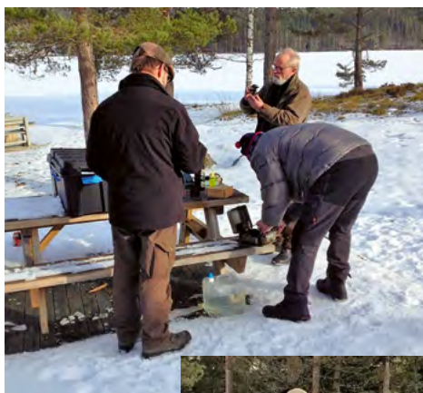
Reparation af primusser.

Afgang fra Enderud ca. 10.30 og så ellers bare følge GPSen hjemover. Første forhindring en rimelig stejl bakke med is på, halvt op, baglæns ned, firhjulstræk på og ganske langsomt op over bakken, godt at have firhjulstræk og en god chauffør. Når man følger en GPS og har indtastet hurtigste vej er det ikke altid den nemmeste, havde det været sommer havde det sikkert været en køn og god vej, men nu var det vinter, så