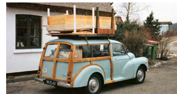
Feb 1995, Gl Frederiksborgvej 31. En ganske udmærket flyttebil.