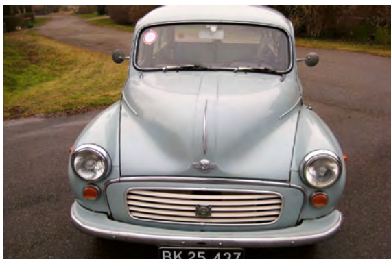
Nov 1973, Enghavevej 7A. Med køretilladelse i for-ruden. Bilfri søndage på grund af oliekrisen