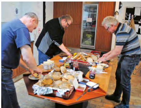
Forplejningen er i orden på Generalforsamlingen.

Generalforsamlingen blev atter afholdt på Autogalleriet i Herning. Fremmødet var stort, både fra Norge, Sverige og Danmark. Det efterhånden meget rutinerede hold fra Vestjyllandsgruppen sørgede for morgenkaffe med rundstykker, frokost og eftermiddagskaffe med kage. De får det til at se ud som om det er let at stå for arrangementet, men vi kan godt se, at der er meget arbejde både før og efter, så jeg vil gerne benytte min mulighed her for at sige tusind tak for indsatsen til jer, der knokler, for at vi kan have en superhyggelig generalforsamling!