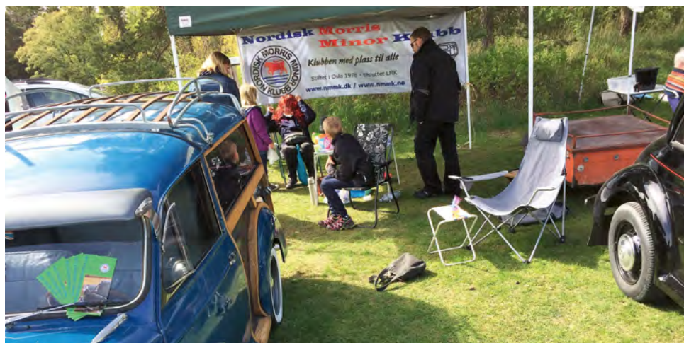
Foto fra NMMK's PR-Stand på Ekebergmarkedet.