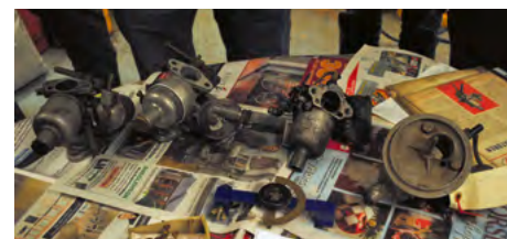
Det tekniske bord var dækket fint op til aftenen.