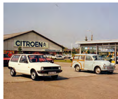
Juni 1986 VAG Helsing, Polo afhentes. Morrisen går nu på aftægt.