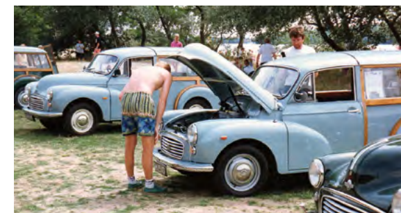
Juli 1992 Morris-træf Tåsinge. Interesserede tilskuere.