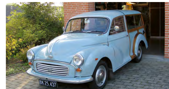
Okt 2015 Gl Frederiksborgvej 29. Hjemme foran garagen i vores nye hus.