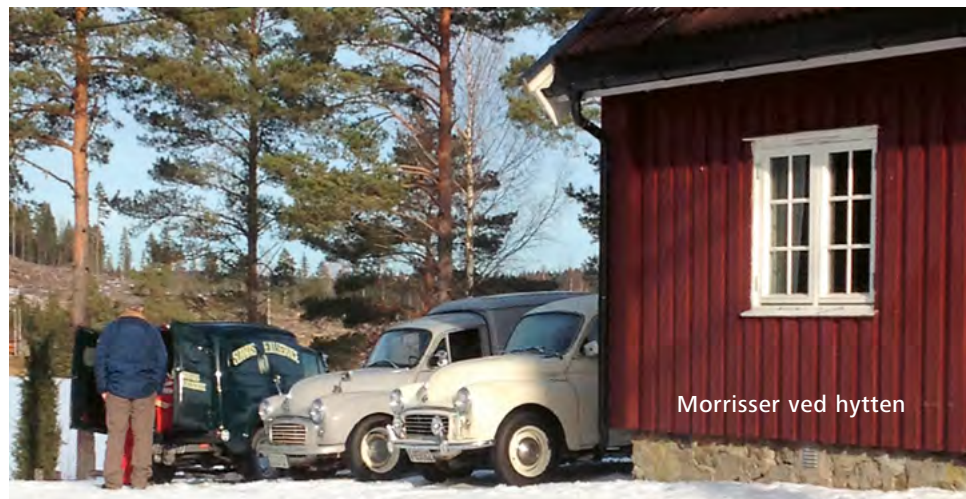
Morrissen ved hytten