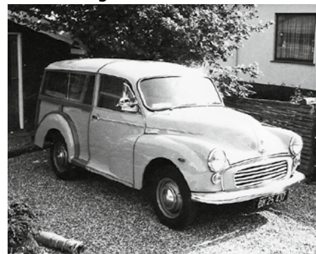
Foto fra 26. Maj 1970 hvor den nye vogn netop var ankommet fra forhandleren August Benz i Helsinge.

Den har praktisk talt ingen rust, hvilket uden tvivl skyldes den meget grundige behandling, jeg gav den som helt ny og ren.