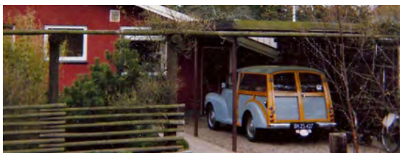
April 1979, Enghavevej 7A. Den har altid stået i tørvejr.