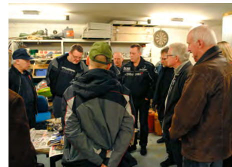
Per's forklaringer blev fulgt nøje og drøftet.