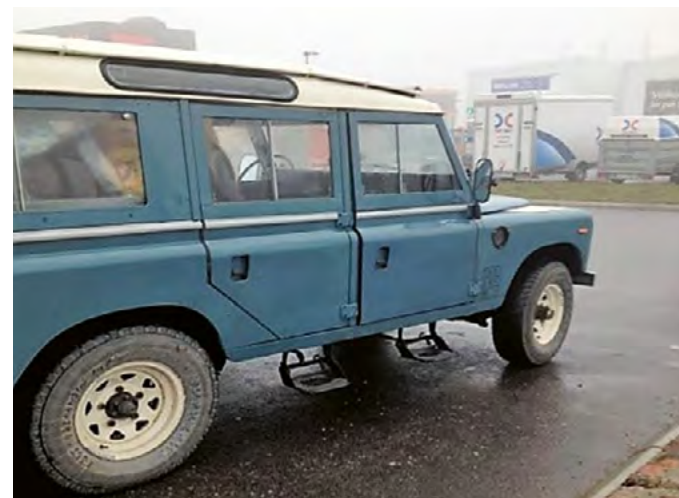
Land Rover i tågen

Lørdag morgen efter morgenmad var det så tid til at køre mod træfpladsen, på vejen derud blev der nogle stop så man kunne få tanket op og mødes med deltagere til primustræffet som koblede sig på. I Kongsvinger blev der provianteret så alle kunne klare sig weekenden over og så videre mod træfpladsen.