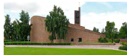
Fra luften ligner Nørremarkskirken en hjertemusling og fra hovedvejen ligner den et skib, hvor kirketårnet er skibets mast.

Vi skal bidrage til markedsstemning og fest ved den årlige Markedsdag. Bilopstilling ved kirken kl 12:00-14:00 – kom eventuelt kl 10:30 og vær med til den udendørs gudstjeneste.