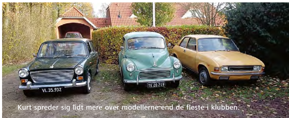
Kurt spreder sig lidt mere over modellerne end de fleste i klubben.

I 1998 ringer der så en dame fra Viborg til mig på Morrisslageret og spørger om jeg ved hvem der mangler en Minor, da hendes bror var død fra den. Jeg ringer til nogle stykker, men de mangler ikke. Så kunne jeg da også selv køre til Viborg og se på den Morris. Der stod en rimelig fin Sage Green Minor fra 1958 med sine sorte TE (Viborg) nummerplader. Havde kun kørt 112000 km. Det var netop i maj 1958 der kom 2 bogstaver på nummerpladerne. Hvis den blev afmeldt kunne man ikke få de sorte nummerplader med 2 bogstaver igen på det tidspunkt.