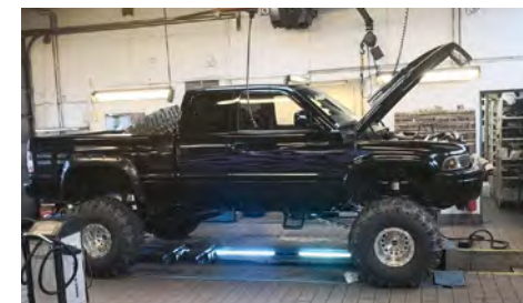
Ikke kun Morris er spændende biler hos Søndermarkens Auto.