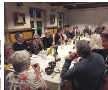
Mange valgte at overnatte på hotellet både natten før og natten efter. Her er det holdet lørdag aften.