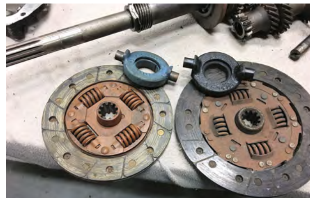
2 koblingsplader og 2 udrykker lejer, at tage fejl af.