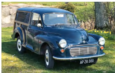
En flot Trafalgar Blue Traveller, årgang 1968, er renoveret på Bornholm.

Projektet har taget cirka 1 år fra anskaffelse til den stod nysynet. Nu venter vi spændt på, at de bestilte sorte nummerplader ankommer sidst på ugen og vejret forhåbentlig arter sig med forårssol, så vi kan komme ud at køre. Der kommer lige et par billeder af det helt færdige resultat.