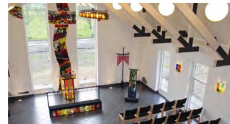
Kirken ved Møgelkær Fængsel

Møgelkær Fængsel er nedlagt og på vej til at blive uddannelsessted for fængselsbetjente. Der vil være rundvisning i fængselsmuseet og i kirken. Medbring selv kaffe/kage eller andet du ønsker – der er gode borde/stole. Info og tilmelding inden torsdag den 23. maj til Karl på tlf. 2853 2301. Mødestedet er Møgelkær Fængsel, Møgelkærvej 18, 7130 Juelsminde.