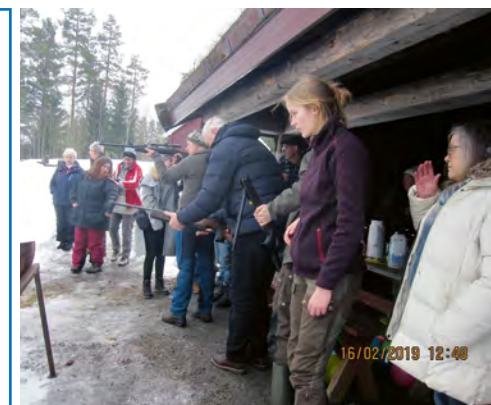
Landskamp stemning – ballonnerne var foran dem l-a-n-g-t ude.