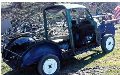
Renoveringen blev klarer indenfor bare 1 år.

Hele bilen inkl. motorrum er slebet ned og lakeret i "Trafalgar Blue" autolak. Der er renoverede sorte sæder og lagt nye måtter i bunden. Motoren har været ude og er renoveret med nye pakninger overalt, hovedlejer, krumtap lejer, forkammerkæde, stempler og olieringe samt topstykket gået efter og slebet ventiler.