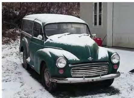
Ladefund – den havde stået stille i 19 år.

Som lovet oplysninger om Travelleren. Den er et ægte ladefund her fra Bornholm. Har ikke kørt i 19 år. Den er oprindelig født som gulpladebil i 1968, men er i 1976 konverteret til hvide plader, med bagsæde og hele sideruder – altså et stort glas, uden rude, der kan skydes til side.