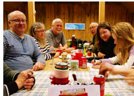
Hygge i de opvarmede stuer.