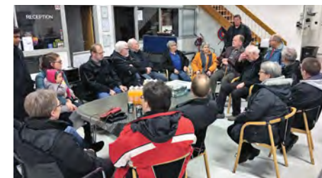
Fin opbakning til et nemt arrangement – det kan anbefales også i andre lokalgrupper!