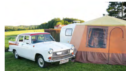
Morris Oxford, Løgballe Camping, 16. april 2011.