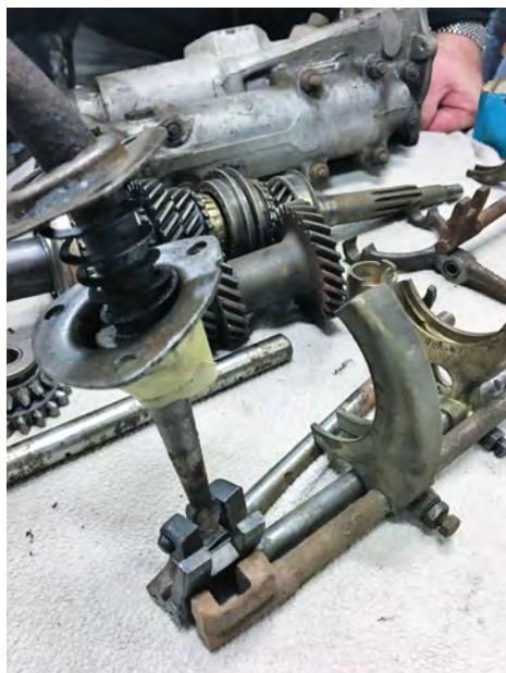
Hvad flytter gearstangens nederste del med?

At skille en gearkasse ad kan man godt – men det anbefales ikke at forsøge en reparation og selv at samle – hvis man ikke er øvet og har stor respekt for alle delene! Vi andre med en rimelig teknisk interesse, kan alligevel komme hjem med mange nye indtryk. Det gav en baggrundsviden alt udi hvordan gearkassen er opbygget og lidt mere om funktionen end at den bare udveksler motorens kraft til baghjulene – i forskellige forhold, f.eks. at 3. gear udveksler 1,412:1 i 948 gearkassen og 1:1 i 4. gear.