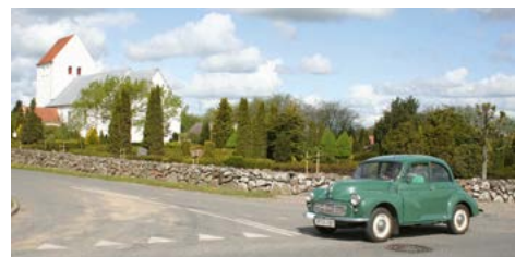
Foran Horne Kirke skulle der tælles træer plantet i stendiget.

Folk nyder de gode og kendte rammer på Gudenaå Camping – det er hygge fra start til slut. I år var køreturen udformet som et orienteringsløb med små opgaver undervejs. Det aktiverede alle i bilerne – og det var godt at være flere til opgaverne.