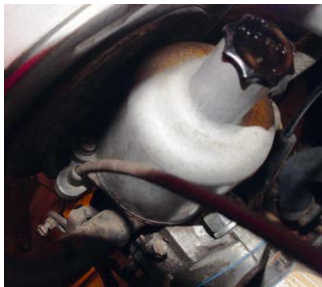
Chokerkablets normale leje i holderen på karburatoren.

ikke telefonen og svarede ikke på de beskeder, jeg lagde. Så kom jeg i tanke om, jeg er medlem af Falck, men har aldrig brugt dem, da jeg plejer, at kunne klare det selv. Jeg ringede, var nummer 7 i køen, kom igennem, MEN DE KENDTE IKKE VEJEN (Spånebak). Selvom jeg holdt lige ud for skiltet og stavede navnet for hende, sagde hun, den vej fandtes ikke i Holbæk. DET ER EN MINIMUM 50 ÅR GAMMEL VEJ MED MANGE INDUSTRI- OG HÅNDVÆRKSFIRMAER PÅ. Jeg prøvede at forklare i forhold til andre veje i byen, men hun kendte overhovedet ikke Holbæk, så det var nyttesløst. Det var lige ved siden af min gamle skole, men den har fået nyt navn efter kommunesammenlægningen, som jeg ikke kender, men hun lovede at prøve at finde det ud fra skolenavnet, men der ville gå minimum 1½ time!