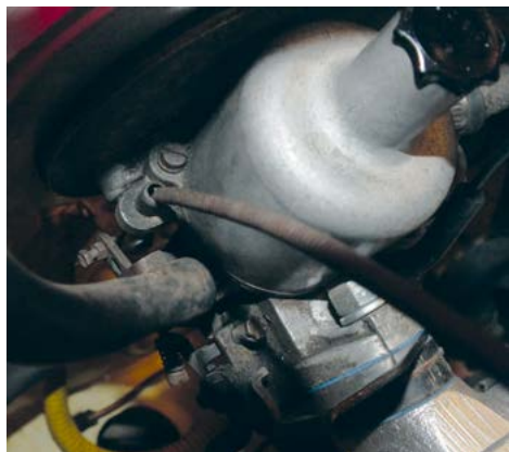
Da Asbjørn trykkede chokeren ind igen efter start hoppede kablet bare ud af holderen i stedet for at trække strålerøret tilbage. Yderkablet hænger på kanten af holderen på fotoet. Vær i øvrigt opmærksom på, at yderkablet kan komme til at hænge som på fotoet af andre årsager, så tjek det, hvis motoren går dårligt kort efter start.

ikke telefonen og svarede ikke på de beskeder, jeg lagde. Så kom jeg i tanke om, jeg er medlem af Falck, men har aldrig brugt dem, da jeg plejer, at kunne klare det selv. Jeg ringede, var nummer 7 i køen, kom igennem, MEN DE KENDTE IKKE VEJEN (Spånebak). Selvom jeg holdt lige ud for skiltet og stavede navnet for hende, sagde hun, den vej fandtes ikke i Holbæk. DET ER EN MINIMUM 50 ÅR GAMMEL VEJ MED MANGE INDUSTRI- OG HÅNDVÆRKSFIRMAER PÅ. Jeg prøvede at forklare i forhold til andre veje i byen, men hun kendte overhovedet ikke Holbæk, så det var nyttesløst. Det var lige ved siden af min gamle skole, men den har fået nyt navn efter kommunesammenlægningen, som jeg ikke kender, men hun lovede at prøve at finde det ud fra skolenavnet, men der ville gå minimum 1½ time!