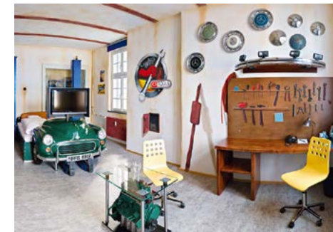
Værkstedstema i dobbeltværelset på V8 Hotel

I Stuttgart har de et specielt by-område til "biler og motor". Her findes også hotellet "V8 Hotel" hvor nogle værelser er med tema fra bilverdenen. Det ser meget gennemført ud og der findes naturligvis VW Boblen og Mercedes – men også et "Werkstattzimmer" og her har man så valgt en engelsk Morris Minor som tema ....! Det er et firma Auto-moebeldesign.de, der har ændret en engelsk indregistreret bil (nummerpladen MHO 228 F) til sengegavl. Der er også billeder af den originale bil på hjemmesiden.