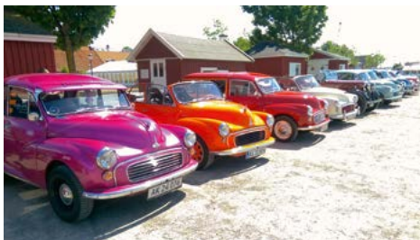
Fuld farvepalette til Drengerøvsaften i Skælskør.

Teltet blev pustet op, og luftmadrassens indbyggede 220V pumpe, fik lov at prøve den i Minoren nyinstallerede omformer, og kort efter stod valget mellem en lur, eller en samlet tur til Skælskør. Det var et nemt valg.