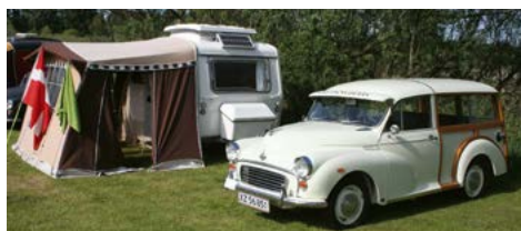
Snowberry til Pinsetræf i flot campingstil.

Fælles grill og amerikansk lotteri sluttede en god lørdag i Brædstrup og omegn.