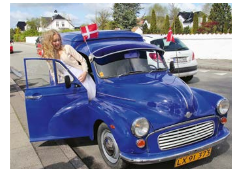
Alberte var glad – det var farfar, der kørte!

Vi har Gud ske lov ikke hørt om sager eller uheld – men det kan få ganske alvorlige konsekvenser hvis det går galt. Vi kan derfor kun råde vores medlemsklubbers medlemmer til at tænke sig rigtig godt om. Hold jer til den nærmeste familie og venner hvor det kan gøres som en gave.