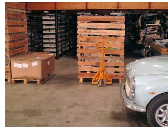
Varer fra Sri Lanka pakket til England, på lageret i Asferg