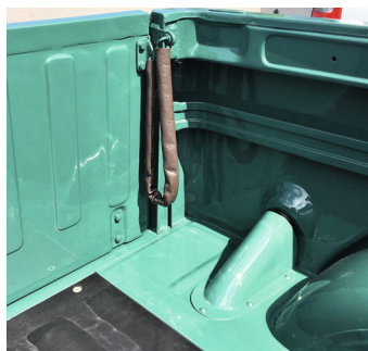
Mange fine detaljer.