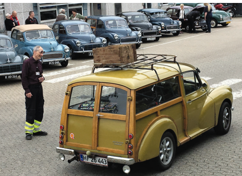
Køreturen lørdag gik til det tidligere Hede Nielsen, Horsens. Industrieventyret lukker på adressen til efteråret.