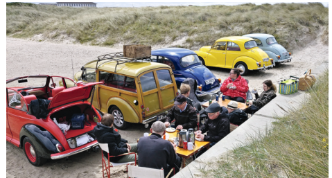
Frokost i Nr. Vorupør

Herefter til Stenbjerg og forbi Stenbjerg Landingsplads... Så med sol og blæst videre til Nr. Vorupør hvor vi fik parkeret så vi kunne sidde i læ og spise vores medbragte frokost.