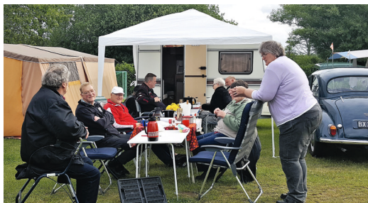
Udendørs morgenkaffe lørdag.