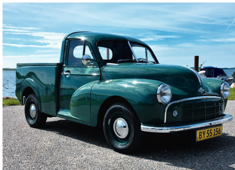
Morris Minor PickUp 1953 – den venter på historisk korrekte gule nummerplader.