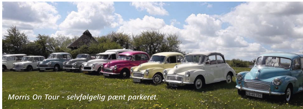
Morris On Tour - selvfølgelig pænt parkeret.