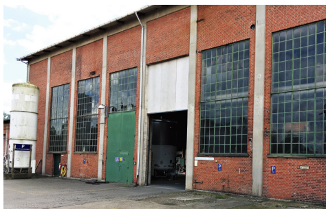
Der er skønhed i gamle industribygninger – men planen er at rive alt ned og bygge lejligheder.