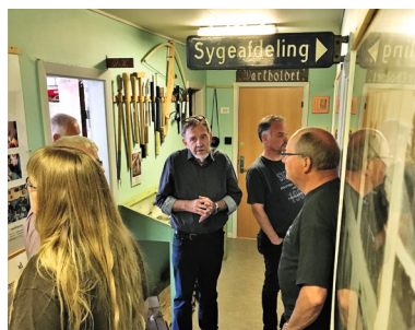
Lidt snævert på museets gange.