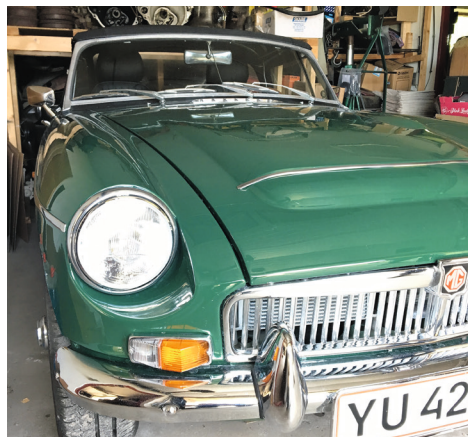
MGC – 6 cylindret