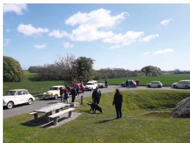
Damestenen er et godt udflugtsmål.