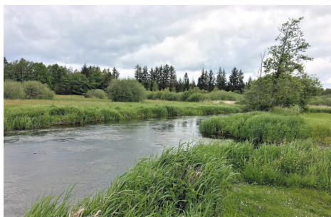
Hvert år nyder vi Gudenåen lige ved Morris pladsen – den fortjener et billede!