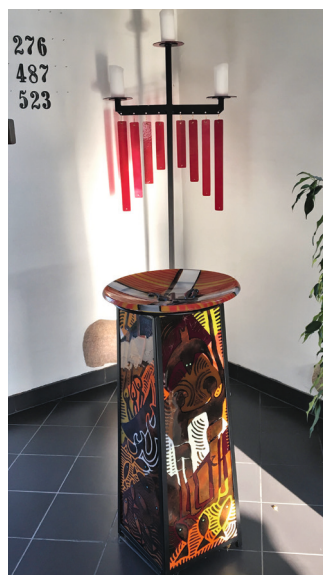
Glaskunst på døbefonten.