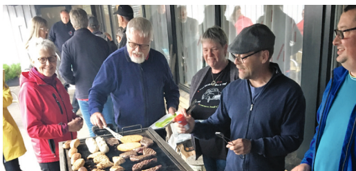
Fine forhold til fælles grill om aftenen på Gudenå Camping.