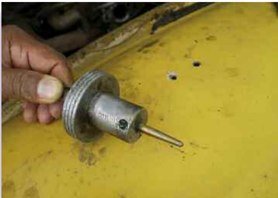
Overstørrelse nå mildt sagt. Ingen dæmperstempel.

fast til luftfilterhuset med en snor så motoren kunne suge gassen til sig og et hvor der var boret en studs ind i siden på karburatoren. Begge havde en gasflaske stående foran passagersædet. Begge havde benzinpumpe og kunne starte og køre på benzin.