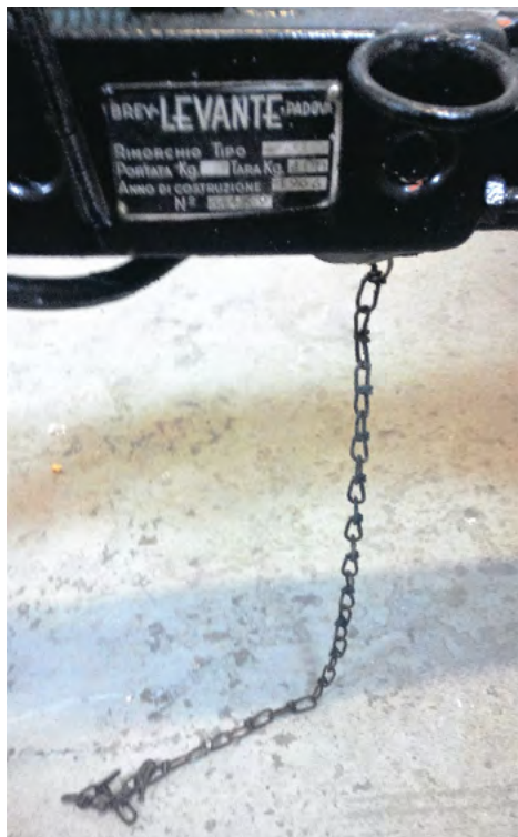
Den famøse gamle kæde var ikke stærk nok.

Desværre var bremskæden, som skulle stoppe campingvognen, af en helt forkert type og desuden gammel og rusten (billede 6).