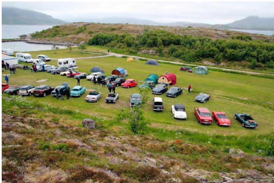
Vy över delar av campingen.

Framme vid Torghattens camping i Brønnöysund är vi vid 16-tiden. Medan vi iordningställer Lillebror och förtältet passerar Hurtigrutten ute på fjorden.