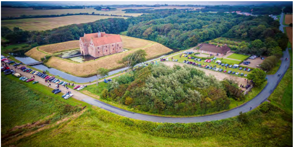
Udflugtsmålet lørdag var Spøttrup Slotsruin - de 205 biler fyldte godt i området.

En helt igennem dejlig weekend – selvom lørdagen var meget til den fugtige side.