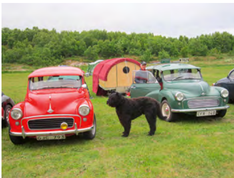
Svensk bilarna med Lillebror i bakgrunden och hunden Egil.

Färdmedel till Engelsk bilträff i Brønnøysund, är vår Morris Minor Traveller 1958, med oss Ove & Harriet Ajdén samt hunden Egil, vår trogne följeslagare på alla träffar. På släp efter Morrisen har vi vår tältvagn Lillebror från 1958.