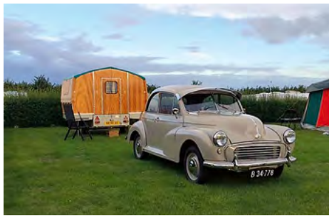
Skippers fine træk på Hejlsminde Strand Camping.