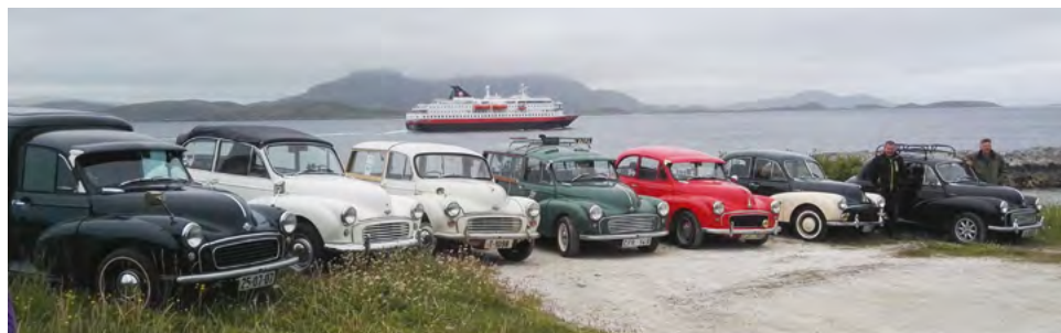
Träffens 7 stycken Morris Minor med Hurtigrutten i bakgrunden.