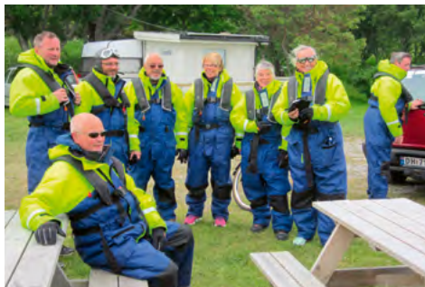
Passagerare laddar för en åktur med RIB-Båten.

Vid målgången fick publiken rösta fram finaste bilen vid träffen och dom valde Jan.p Arntzbergs röda Austin Mini Pick Up från 1969 till vinnare.