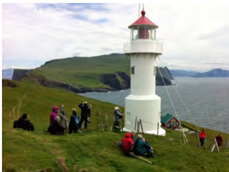
Færøerne er noget helt specielt!

Da jeg er blevet opfordret til at lave en tur mere til Færøerne, vil jeg lave en tur i 2020 sidst i juli efter Sveriges træffet. Denne tur vil blive lidt anderledes end den første tur. Denne gang vil vi en tur ned til det sydligste af Færøerne og en tur ud til det østligste punkt.