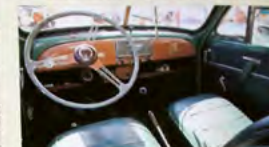
Så här ser en orörd, embonad Morris Minor-kopi från 1952 ut. Skinnklädet på sätena och detaljvindruta förhöjer känslan.