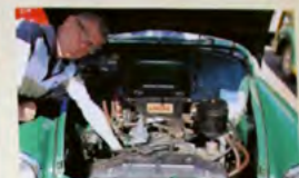
Göran Solvagn från Ljungby låtsas skruva på sin sidventilmotor från 1952 - egentligen bebövs det sällan.