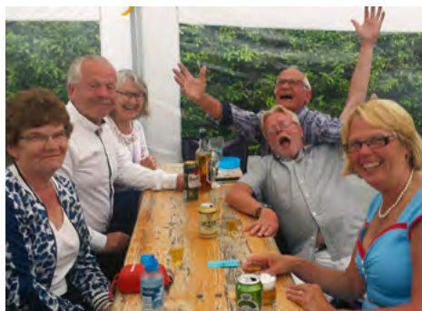
Meget hygge i Hjo!