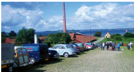
Teglværksmuseet på flot placering.