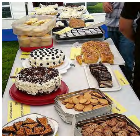
En rigtig god tradition i Sønderjylland!