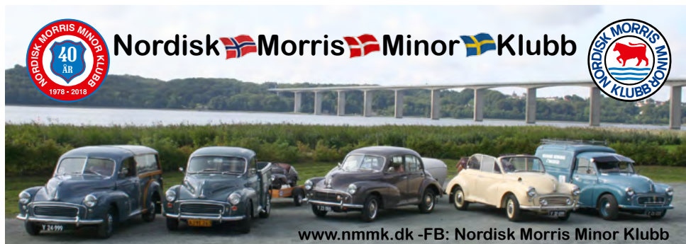
Klubbens jubilæumsstreamer i anledning af de 40 år i 2018.

Helt kontant, så har vi vedlagt 2 jubilæumslogoer samt en streamer i kuverten med Kalenderen for 2018 og selvfølgelig NORMINOR nr 5-2017.