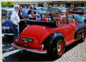
Jørgen Eldrup hade hållit på länge med sin cabriolet när den blev klar 2016 - i 20 år faktiskt. Nu är den veckert tvåfärgad, med breddade plåtfälgar och modernare säten.