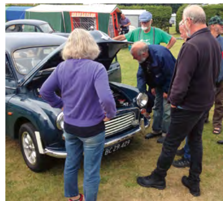
Hvad mon det er alle disse eksperter studerer i motorrummet?

Sommertræffet i Hjo bød ikke på ret mange motorproblemer men så bliver der tid til at studere andre detaljer.