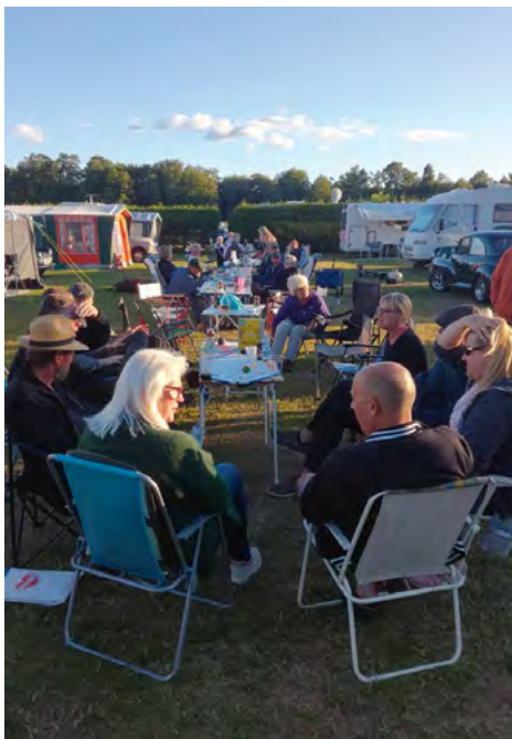
Hygge på campingpladsen i Hjo.

Facebook gruppen blev flittigt opdateret med billeder og endnu flere er modtaget her på min egen redaktion. Jeg håber at efteråret må give tid til at lægge et passende udvalg på hjemmesiden.