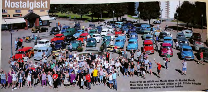
Torget i Hjo var välfyllt med Morris Minor när Nordisk Morris Minor Klubb hade sin årliga träff i mitten av juli. 62 bilar trängdes tillsammans med sina ägare, Hjo-bor och turister.