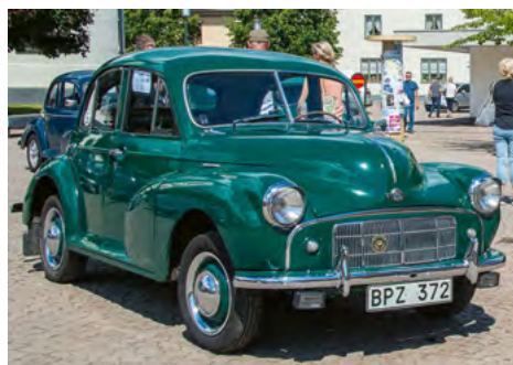
Morris Minor 1951, sideventilet motor. Medlemsnr 3663