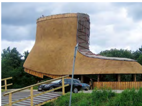
En ny turistattraktion er bygget; "Støvlen".