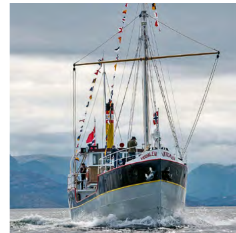
Det stolte, restaurerede skib VÆRDALEN

Explore with him how the so-called Scandinavian Navy's lumber schooners and seamen were instrumental in developing the United States' western frontier by providing lumber to build cities.