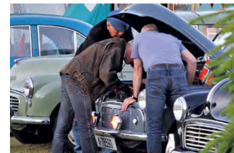
Morrisfolk kender heldigvis deres biler og kan drøfte tingene!

Et af de emner, der kommer op igen og igen, er spørgsmålet om, hvorvidt man skal bruge tilsætning til benzinen eller ikke - også kaldet blyerstatning. Så her starter serien med en artikel på næste side.