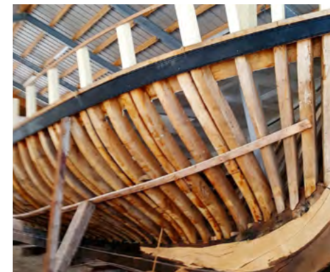
Der er lavet skibsdæk siden sidste års kontrol – Godkendt.

Alt i alt et hyggeligt mini træf i det jyske.