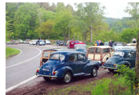
Tilfældigt møde med andre vildfarne deltagere i kortegekørsel.

Der var en vendeplads lige ved et skilt, der viste til højre mod Bouillon. Her vendte vi så alle sammen og kørte tilbage mod campingpladsen. Kaos. Undervejs løb vi jævnligt på grupper af vildfarne Morris'er, og vi hilste altid pænt på de desperate chauffører.