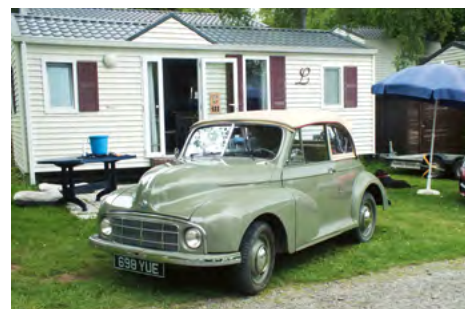
Træffets ældste deltager. Serie MM Tourer fra 1950.

Der var også et par sideventilede Serie MM'er, der havde taget kampen op mod bakkerne.