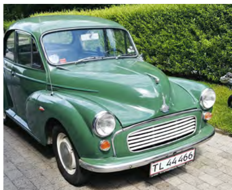
Morris Minor 2-dørs fra 1969

Efter nogle år hvor vi har brugt fritiden på mc, som nu er solgt begge to - har vi fundet denne skønne Morris fra 1969. Der er nogle ting, der skal laves ved den, men den kører.