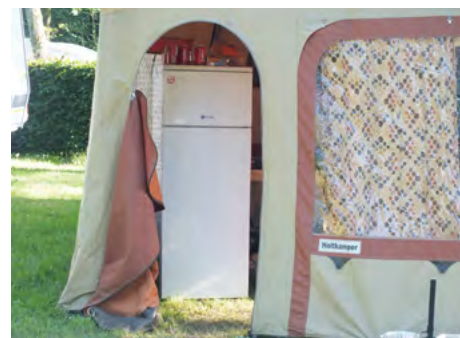
Køleskab i campingstørrelse hvis man er hollænder!

Det var en dejlig dag, så vi vendte hjem til pladsen og fik (igen) en dejlig kold øl – Dét har de styr på, de belgiere! Om aftenen grillede vi sammen med nogle tilsvarende øl-begeistrede hollændere. Vi var noget misundelige på deres køleskab i fuld størrelse! Og så stod der endda også øl PÅ køleskabet!