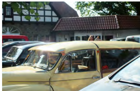
Første stop. Kan anbefale stedets weissbier!

Så de to Travellere fra 1969 blev pakket, og der blev bestilt overnatning både på vej derned og hjem. Så kunne vi tage det stille og roligt, og hygge os lidt undervejs. Det gik også rigtig fint ned gennem Tyskland til første stop.