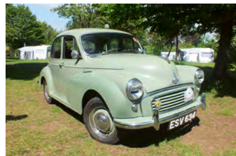
4-dørs årgang 1957. Urørt siden ny bortset fra lakreparation på en forskærm. Utroligt!

Der var også et par sideventilede Serie MM'er, der havde taget kampen op mod bakkerne.