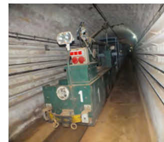
Maginot-linjen. Det lille tog kørte oprindeligt med ammunition.

tvinge tyskerne gennem ardennerbjergene i stedet for. Et brutalt kapitel i anden verdenskrig. Det imponerende bygningsværk blev faktisk aldrig indtaget under kampene, men blev selvfølgelig overdraget til tyskerne efter den franske hær havde overgivet sig.