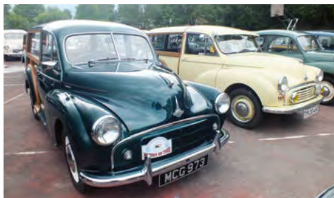
Traveller Serie II 1954.

siden af en rasende flot Serie II Traveller, der havde været i samme families eje siden ny.