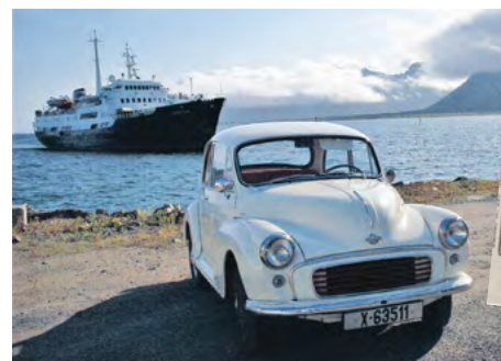
Morris Minor 2-dørs 1963 og M/S Lofoten