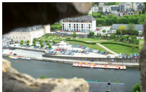
Udsigt til de opstillede Minors fra middelalderborg

Der sprang engang imellem en gnist fra det tykke kabel på tændspolen til en af de tynde ledninger. Det blev klaret med en justering af gummimuffen på tændspolen. Men der var også en underlig tikkende lyd ved nogle bestemte omdrejninger. Det lød som om det kom fra strømfordeleren, men ingen havde et bud på, hvad det var, og nu kørte bilen godt igen. Så var det tid til at være turist med kaffe, frokost og besøg på byens middelalderborg.