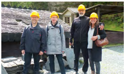
Danskerdelegationen viser seneste hattemode ved indgangen til skiffermine

Næste dag tog vi på en lille udflugt til en skiffermine tæt ved campingpladsen. Det var en stor oplevelse. Vi ved slet ikke hvor godt, vi har det i vore dage!