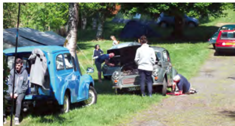
Nødvendigt mekanikerarbejde efter den lange køretur var et vilkår for mange.

Næste dag var vejret bedre, og et mistænkeligt tændrør blev skiftet. Der kom flere og flere deltagere, og vi var langt fra de eneste, der llliiige skulle se på et eller andet, der havde drillet undervejs.