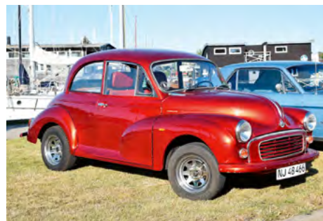
Ejeren her er ukendt – men fin metallic maling på bilen.