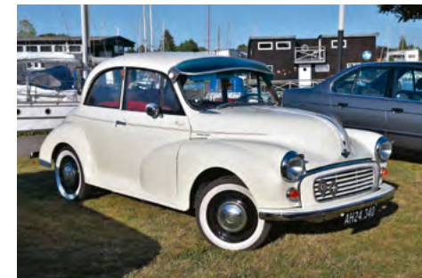
Flot hvid 2-dørs – ejeren er ikke kendt ... men da meget heldig med bilen!