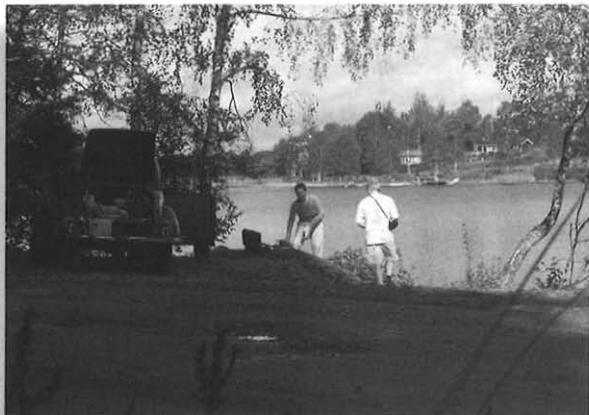
Pause ved idyllisk sø

Lørdag skulle vi på fællestur til den lokale kafé Fjärningen, hvor vi fik lidt godt at spise og hørte om stedets