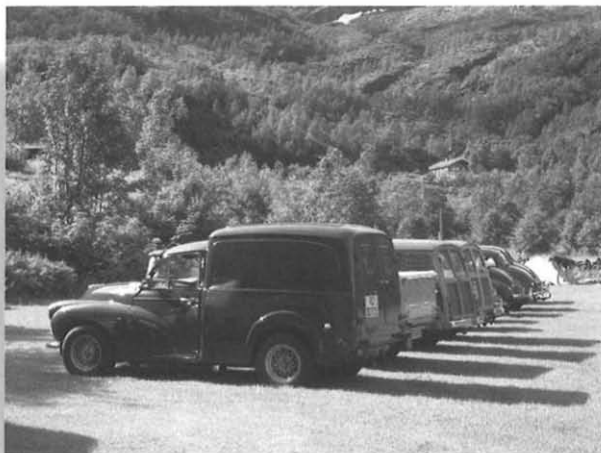
Vinderbiler i Geiranger

I sidste nummer af Norminor, fortalte jeg lidt om mine oplevelser på sommertræffet, men der havde desværre indsneget sig 3 fejl af forskellige årsager.