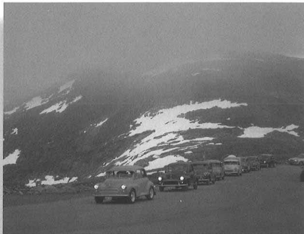
På vej mod fjeldet

Jeg skulle hilse fra dem og sige, at de har det godt.