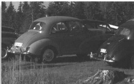
Lars' originale 2-dørs

Lørdag aften var der igen grill, men denne gang blev det suppleret med en let byge (...!) Der var også lotteri og fine præmier. Vi tog en præsentationsrunde, så vi