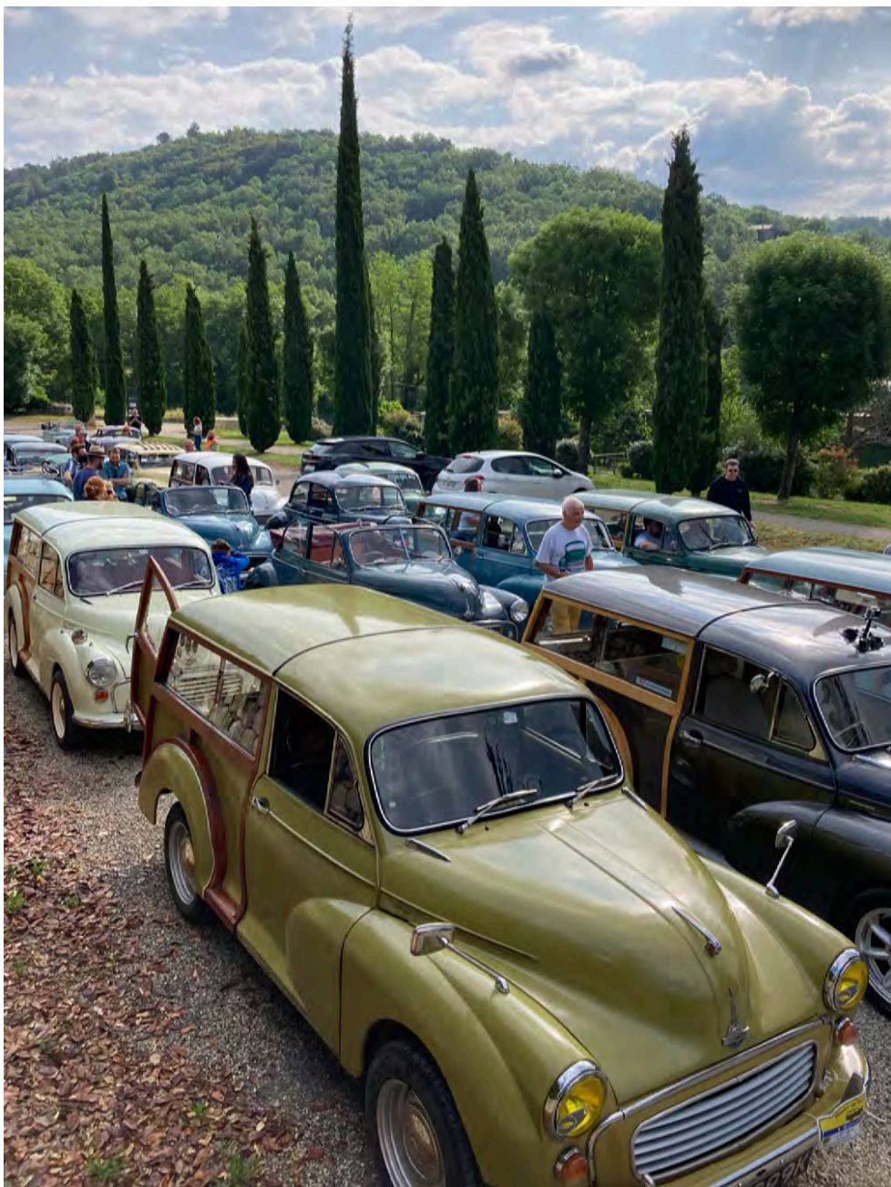
Der lines op til kortegøkørsel