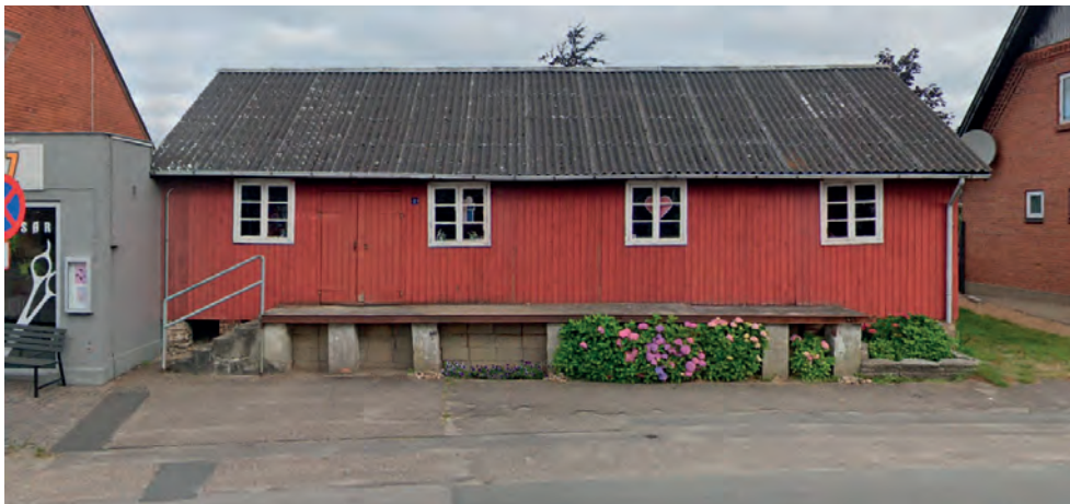
Foderstofhandlen står der endnu – brugt til julemarkeder m.m.