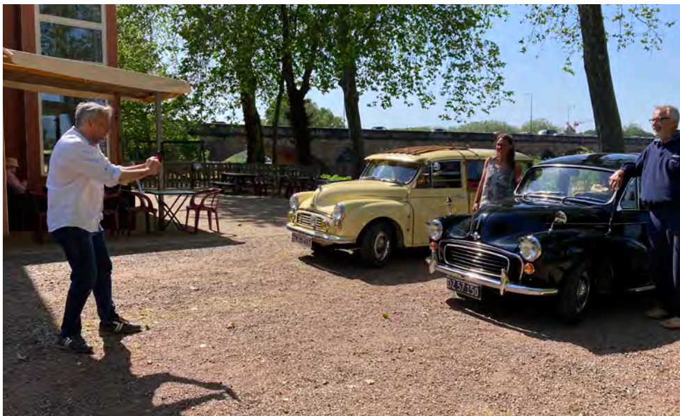
Fotosession. Fik ikke helt fat i hvem, der havde hyret fotografen, men det var vist nok til en eller anden hjemmeside.

På den lokale campingplads lejede vi Nordeuropas mindste hytte og gik ture i byen. Vi mente ikke selv, at vi førte os specielt meget frem, men kunne godt se, at vi tiltrak mere og mere opmærksomhed i løbet af dagene. Der kom flere og flere forbi og fotograferede bilerne, og til sidst var der en turist, der fortalte, at vi var blevet til berømtheder på sociale medier med billedserier helt fra motorvejskørsel i Tyskland og til campingpladsen i Nevers. Et engelsk ægtepar opsøgte os fordi fru'en havde lært at køre bil i en Morris Minor Traveller. Den sidste dag kom der en professionel fotograf, som havde fået til opgave at fotografere os foran byens ikoniske bro over Loirefloden. Helt vildt!