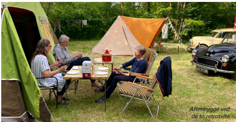
Aftenhygge ved de to retrotelte

Første arrangement var veterancampingtræffet, der blev afholdt i byen St-Leu-d'Esserent ca. 50 km nord for Paris. Vi ankom tirsdag, men træffet begyndte først om torsdagen, så vi havde en hel onsdag til at tage til Paris og se Eiffeltårnet. Vi havde en forestilling om hektisk trafik i Paris, så vi havde ikke lyst til at køre derind i Morris'erne – og slet ikke at efterlade dem på en eller anden parkeringsplads! Så det blev til en togtur med afgang fra nabolandsbyen.