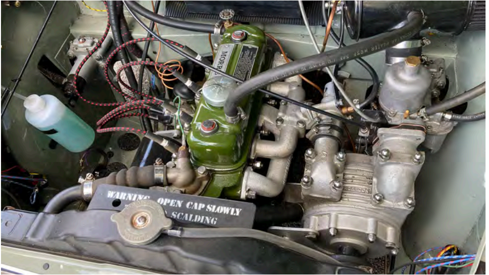
Shorrock kompressor på en 948 ccm motor i en ellers originalt udseende Serie II cabriolet. Den giver 40% større ydelse!